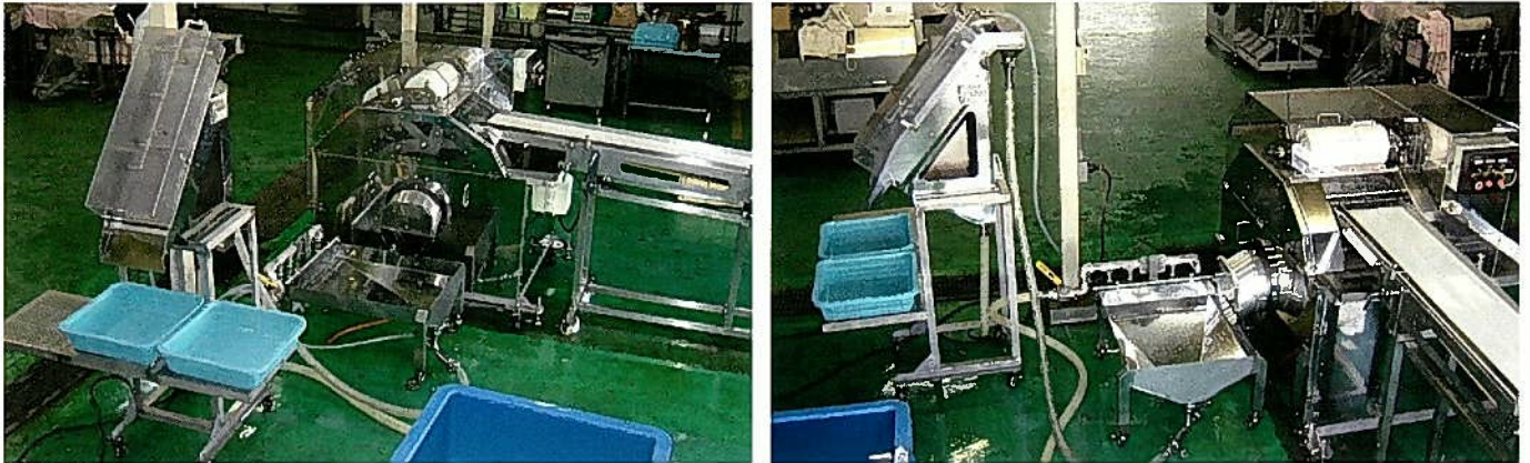
Объединить сикробробивочной машиной модель FRS-102